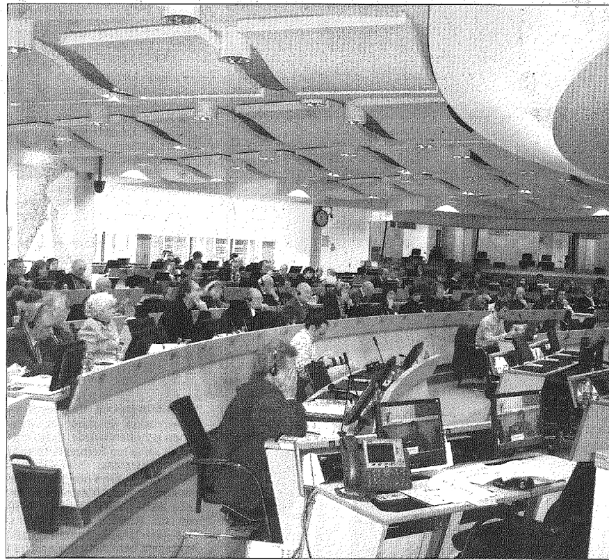
Lors de la présentation du rapport d'information sur l'économie sociale le 3 décembre à Bruxelles

Le 3 décembre dernier à Bruxelles, le Ciriec (Centre international de recherches et d'information sur l'économie publique, sociale et coopérative) présentait son rapport d'information sur l'Économie sociale (ES) dans l'Union européenne élaboré pour le Comité économique et social européen (CESE). INEES était évidemment présent, ainsi que des représentants luxembourgeois du CESE et du CES-national.