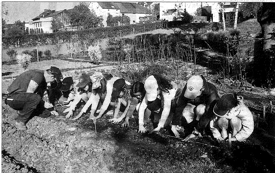
Qui se soucie de regarder la fleur de la carotte sauvage au temps des cerisiers? Sodo, Haïku (poème japonais)

Cette année, nous avons enrichi le programme par la comédie, en y associant „Ile aux clowns“, un projet du réseau Objectif Plein Emploi que le CIGL Hesperange