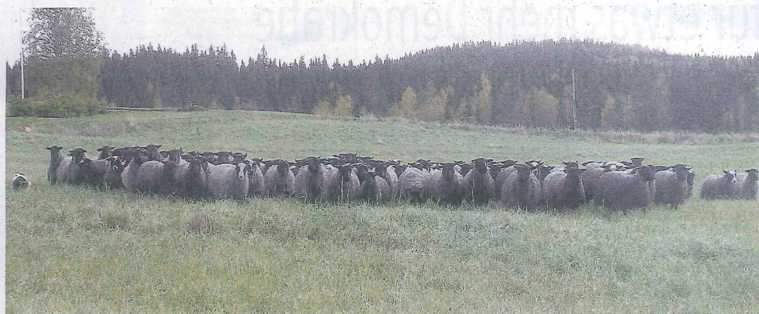
Auf dieser Weide befinden sich rund 200 Jungschafe