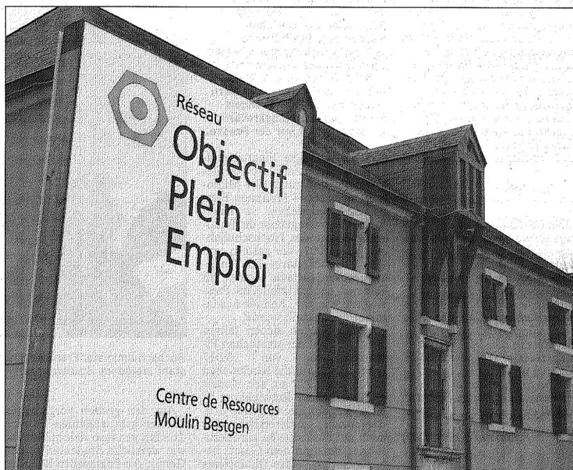
Auch in Luxemburg ist die Solidarwirtschaft eine Realität geworden. Der OPE-Sitz in Schifflingen.